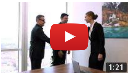
ČKLOP – promo video 2018