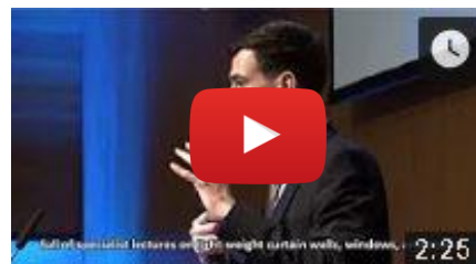
11. národní konference ČKLOP (krátký video-sestřih celého dne)